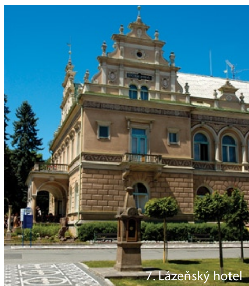
7. Lázeňský hotel

MALEBNÉ MĚSTEČKO LÁZNĚ BĚLOHRAD LEŽÍ V PODHŮŘÍ KRKONOŠ V NÁDHERNÉ, EKOLOGICKY ČISTÉ KOTLINĚ. NA JIHOZÁPADĚ JE CHRÁNĚNO MODRAVÝM HŘEBENEM CHLUMU, NA SEVERU SE VYPÍNÁ KAMENNÁ HŮRA, OD ZÁPADU HLEDÍ ZŘÍCENINY HRADŮ KUMBURK A BRADLEC I HORA TÁBOR. STRÁŽCEM CELÉ BĚLOHRADSKÉ KOTLINY JE ZVIČINA S TURISTICKOU CHATOU.