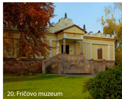
20. Fričovo muzeum