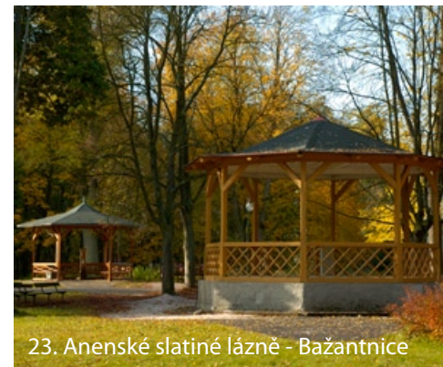
23. Anenské slatiné lázně - Bažantnice