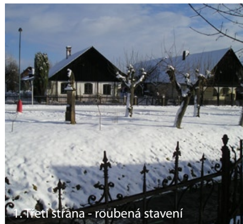
1. Třetí strana - roubená stavení

11. ČESKÁ SPOŘITELNA - ve vstupní předsíni je umístěn mramorový reliéf matky s dítětem s motivem spořivosti a znakem Bělohradu od J. Bílka z Hořic.