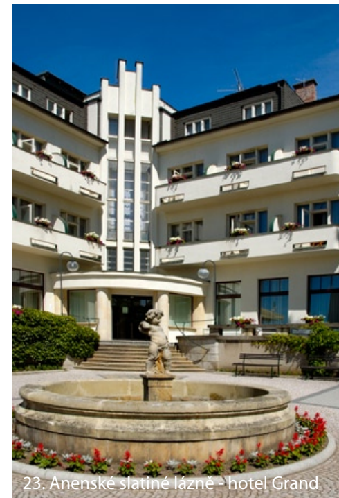
23. Anenské slatiné lázně - hotel Grand