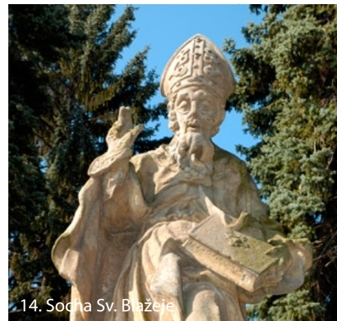
14. Socha Sv. Blažeje

17. Na přilehlém hřbitově je HROB RODIČŮ K. V. RAISE , který se nachází u hřbitovní zíd-ky nedaleko hlavního vchodu.