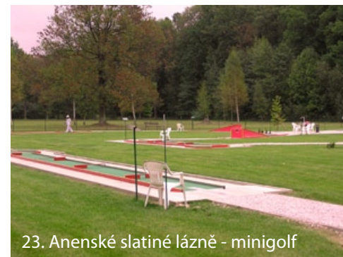
23. Anenské slatiné lázně - minigolf

Mimo centrum se nachází přírodní park Bažantnice, který přiléhá k lázeňským objektům. Je ideálním místem pro vycházky. Park má upravené cestičky a idylická zákoutí. Při hlavní cestě se nachází jezírko Hraběnka s ostrůvkem, na němž stojí kříž z roku 1787. V zadní části parku byl navrtán Annamariánský pramen železité kyselky. V letní sezóně se zde konají oblíbené koncerty. S parkem sousedí sportovní areál (tenisové a volejbalové kurty, stadion, tenisová hala a minigolf).