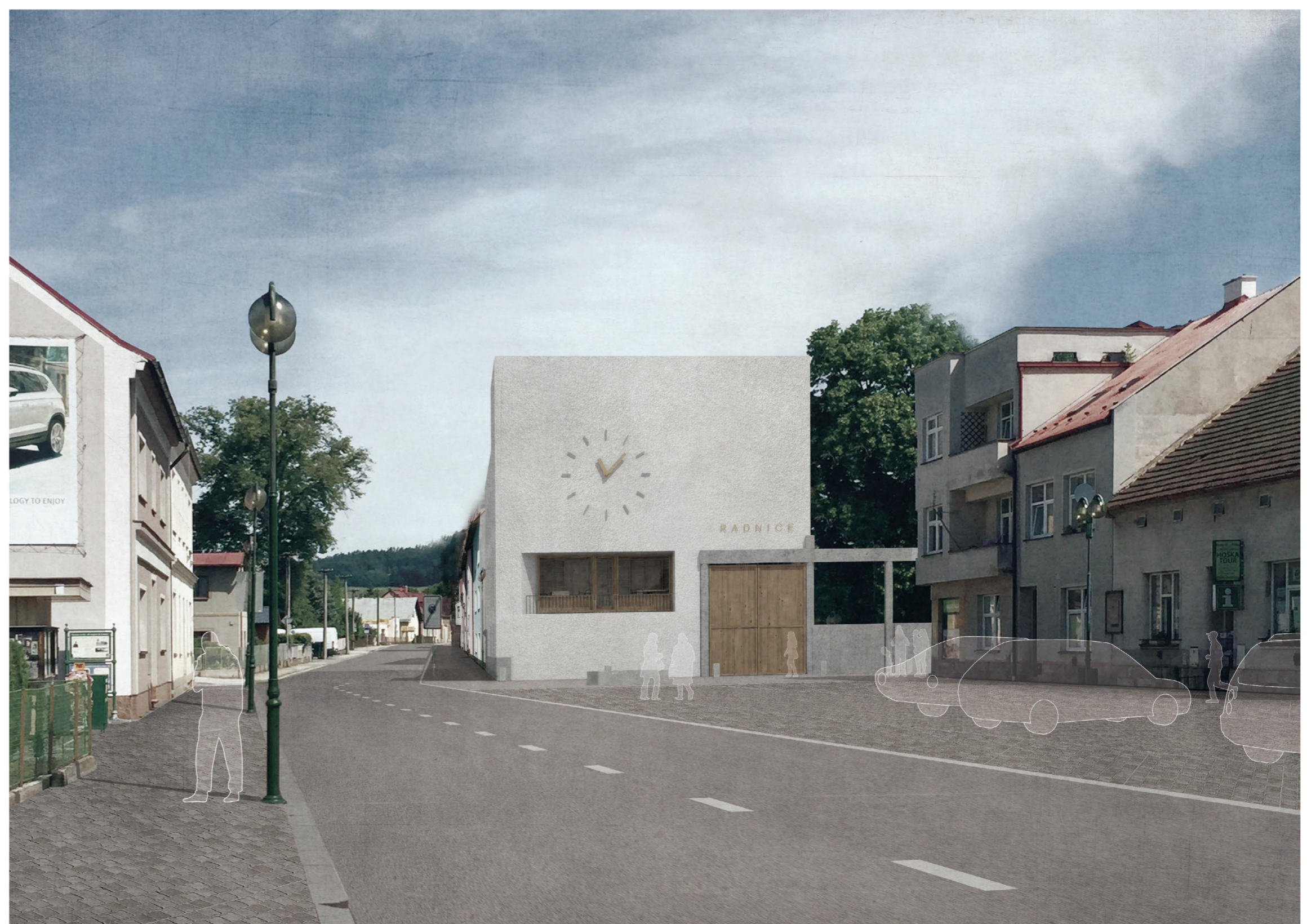
POHLED Z NÁMĚSTÍ