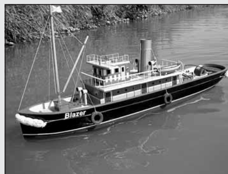
Model britského parníku ze začátku devatenáctého století „Blazer“ poháněného šoupátkovým parním strojem - autor Josef Darvaš