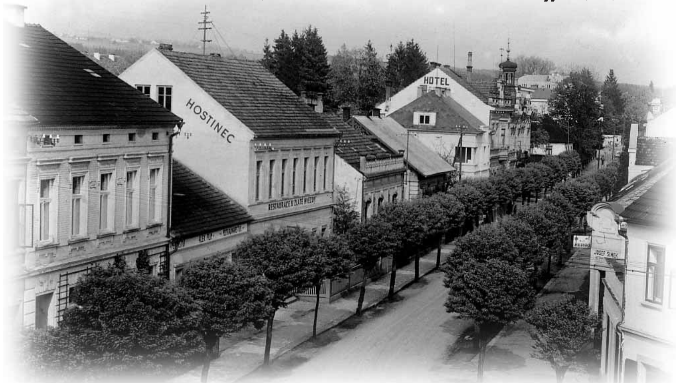
Fotka z roku 1940 - Hostinec u Zlaté neboli Modré hvězdy.