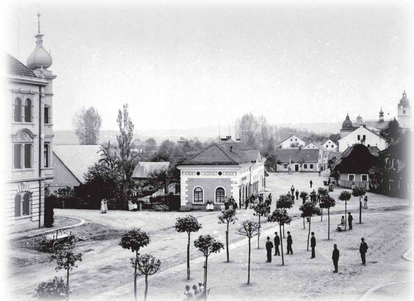
Bělohradské náměstí s „Pižlovým domem“ a jím založeným stromořadím před rokem 1900.

Za pobytu v Praze poznal naše národní a kulturní hnutí, jehož se sám čile účastnil. Osobně přitom poznal mnohé přední muže z literárních a nakladatelských kruhů, se kterými