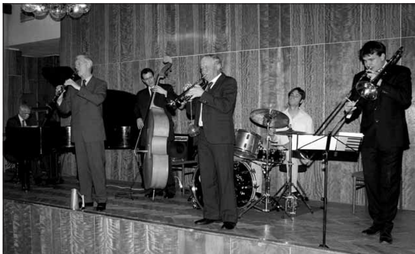
Foto z koncertu pořádaného 22.4.2006 Spolkem Frič společně s Městským kulturním střediskem Lázně Bělohrad v sále ASL.