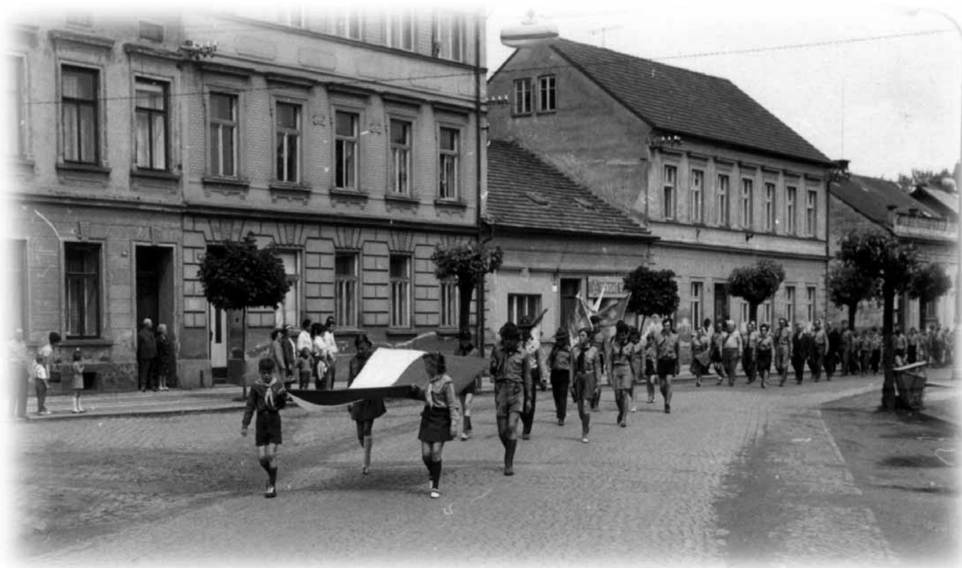
Skautský pochod v r. 1969 před hostincem.