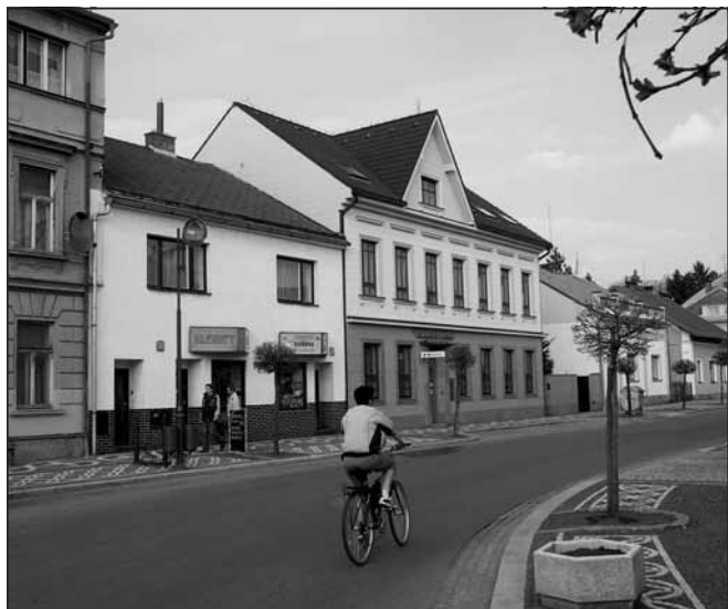
Dnes Komerční banka

Učitel Divíšek přilít do třídy. Vztyk. Nazdar. Zdar. Sednout. Zdeněk k tabuli. Spolužákům jsem diktoval látku a měl dozor. Divíšek rychle vyrazil k Sušákům do hospody, huberták za ním jen vlál. Kafe. Rum. Kafe. Rum. Ale než začal zvonit konec hodiny, tak se vždycky stačil vrátit do školy.