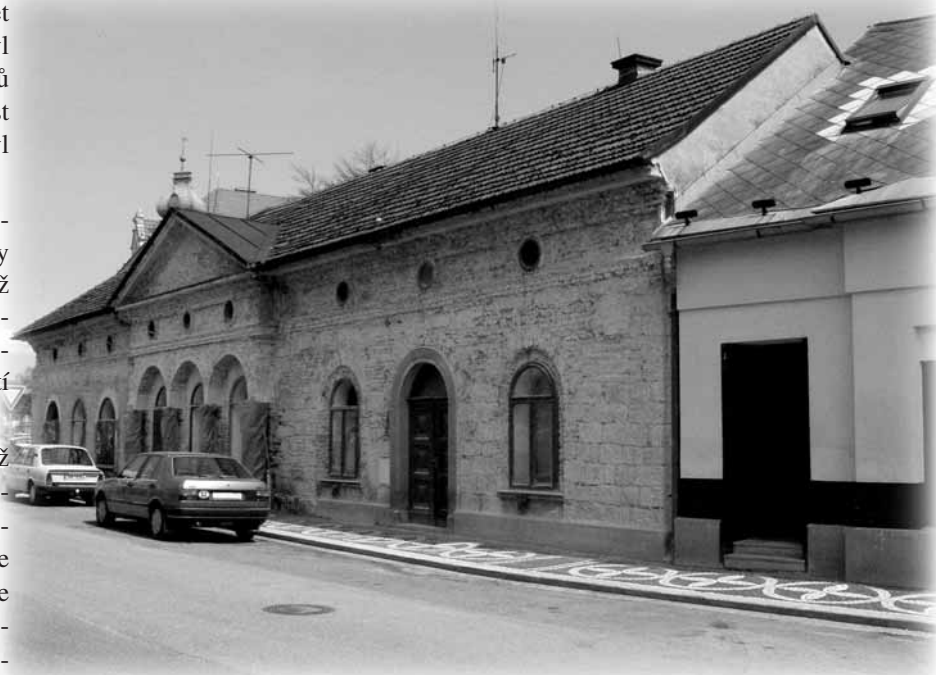
Pižlův dům dnes.

Do dnešních dnů nám čínorodého bělohradského rodáka Jindřicha Pižla připomíná nejen jeho rodný dům č.p. 106 proti lékárně, kterému se často říká „Pižlův dům“ (dnes by Jindřich Pižl ze stavu svého rodného domu radost určitě neměl), ale i další budovy (Fričovo muzeum, Lázeňský hotel, atd), které byly postaveny na přelomu 19. a 20. století, a na jejichž výstavbě se Pižl významnou měrou podílel. Pro dříve narozené a přátele turistiky bude určitě známá také turistická „Pižlova stezka“ z Lázní Bělohradu po Horské cestě a přes Bukovinu na Krkonošskou vyhlídku. Připomíná nám, že Jindřich Pižl necestoval jen v zahraničí, ale miloval a propagoval i turistiky v okolí svého bydliště.