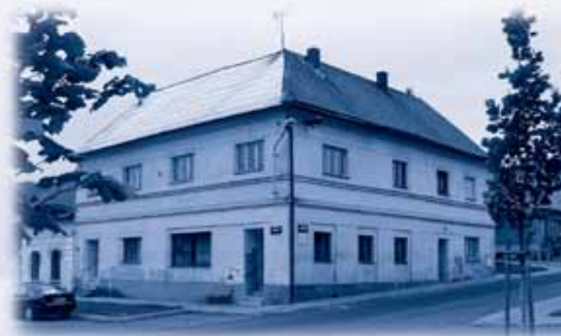
Hostinec U Zeleného stromu