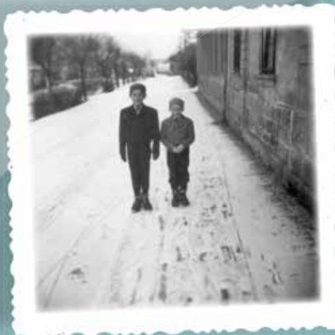
První fotografie z aparátu Pionýr, který bratrům Čelišovým nadělil Ježíšek v roce 1954.