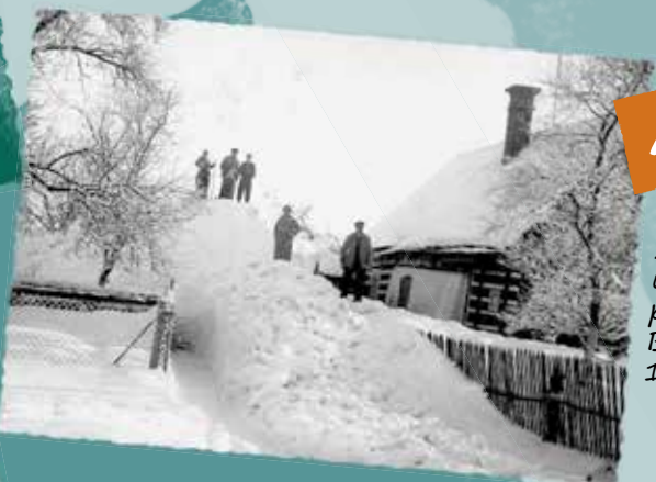
Závěje u domku pana Budínského 111.