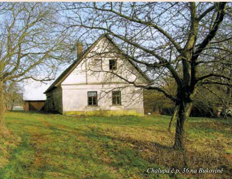
Chalupa č.p. 36 na Bukovině