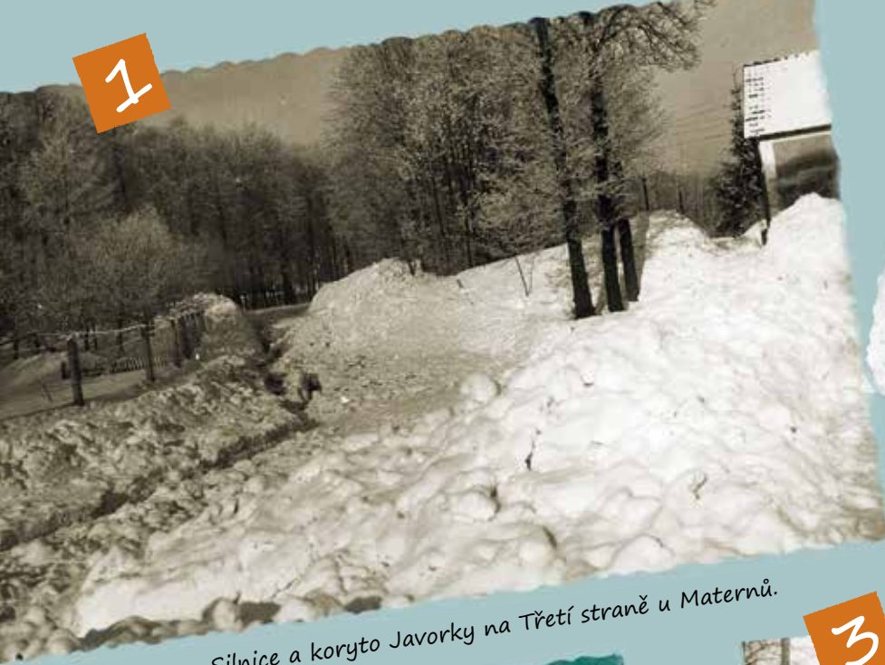
Silnice a koryto Javoroky na Třetí straně u Maternů.