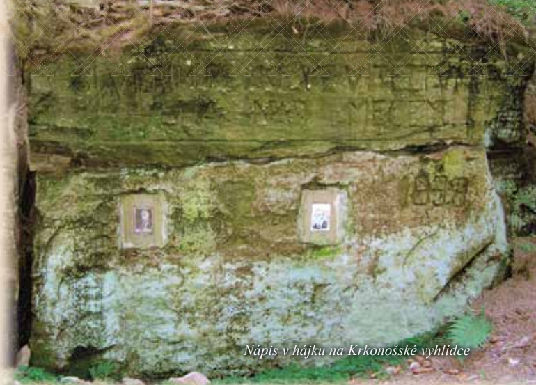
Nápis v hájku na Krkonošské vyhlídce