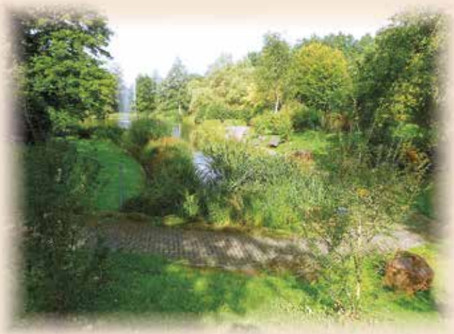
Z Lázeňského parku