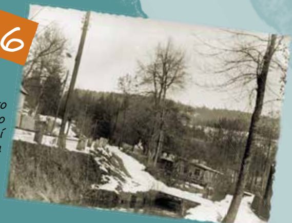
Vpravo náhon, vlevo nad silnicí dům pana Dlaba.