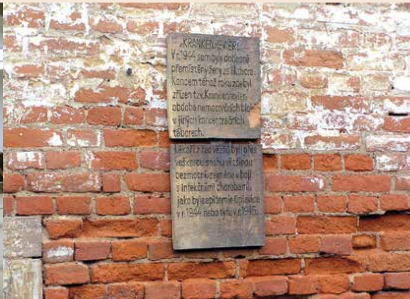
Cela a pamětní deska v Malé pevnosti v Terezíně