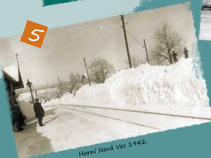
Horní Nová Ves 1942.