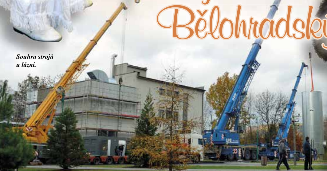
Souhra strojů u lázni.