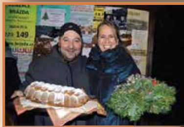
Hezké Vánoce přeji Láňáci.