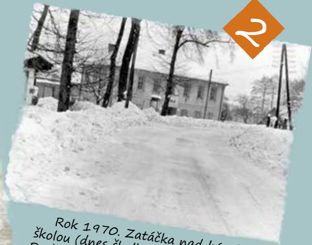
Rok 1970. Zatáčka nad bývalou školou (dnes školkou) v Horní Nové Vsi. Povězte si na levé straně domku, kde se odevzdávalo mléko určené k výkupu.