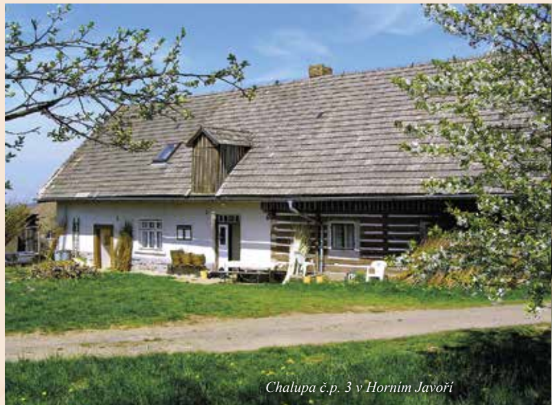
Chalupa č.p. 3 v Horním Javoří